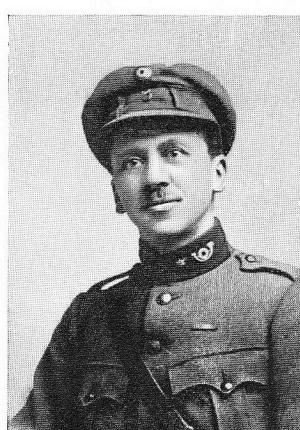
HEINTZ, Albert, né le 11 janvier 1885, à Bastogne.

Volontaire de guerre, remplissant des missions périlleuses, tomba à la tête de son peloton, qu'il conduisait à la contre-attaque de Nieuwendamme, le 18 mars 1918, avait déjà été blessé à Boesinghe, en 1917.